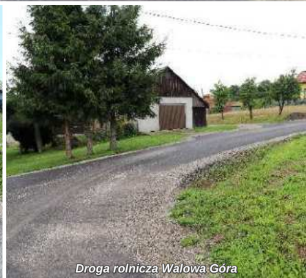
Droga rolnicza Walowa Góra