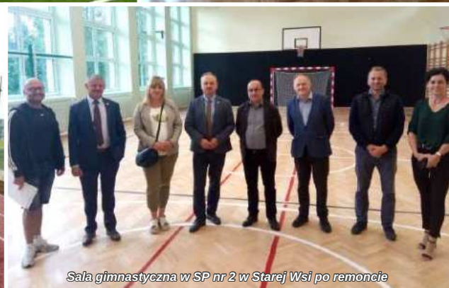
Sala gimnastyczna w SP nr 2 w Starej Wsi po remoncie