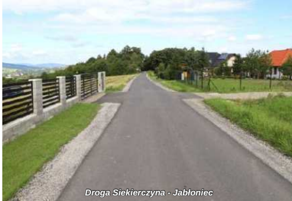
Droga Siekierzyna - Jablonec