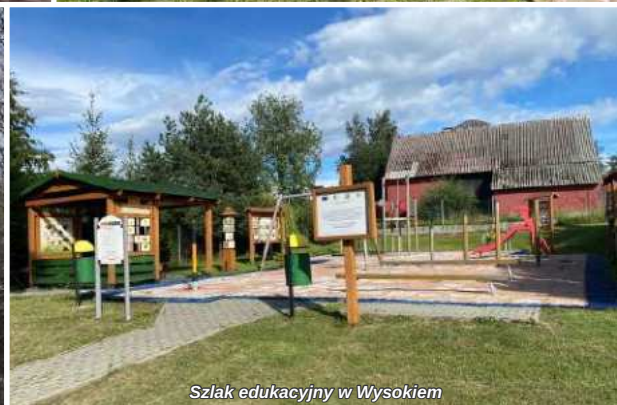
Szlak edukacyjny w Wysokiem