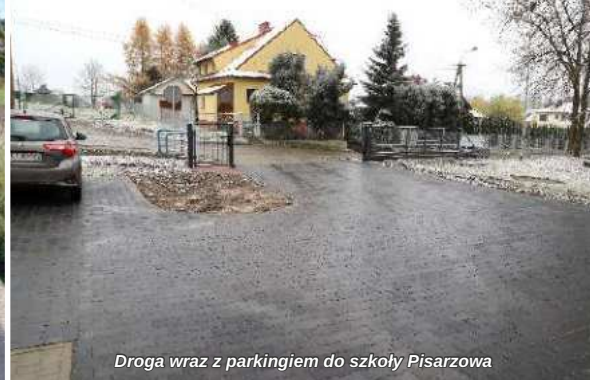
Droga wraz z parkingiem do szkoły Pisarzowa