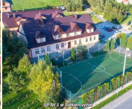
SP Nr 1 w Siekierzynie