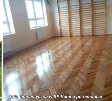
Sala gimnastyczna w SP Kanina po remoncie