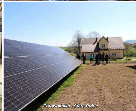
Fotowoltaika - Stare Rybie

Równolegle z rozbudową infrastruktury edukacyjnej, z należytą dbałością traktowana jest oferta edukacyjna szkół. Przez ostatnie lata szkoły zostały doposażone w nowoczesny sprzęt komputerowy i multimedialny wraz z dostępem do szerokopasmowego internetu oraz liczne pomoce dydaktyczne do każdego realizowanego przedmiotu.