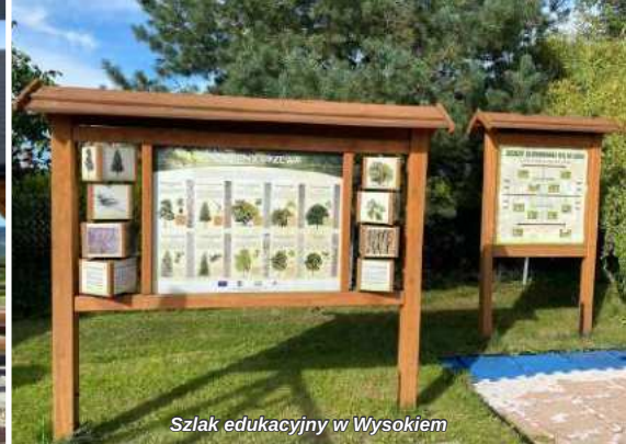
Szlak edukacyjny w Wysokiem