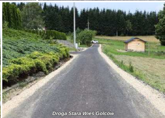
Droga Stara Wieś Golców