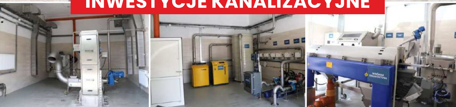
Oczyszczalnia ścieków w Starej Wsi

Na początku kadencji Gmina Limanowa posiadała pięć oczyszczalni ścieków w miejscowościach: Męcina, Mordarka, Siekierczyna, Stara Wieś i Młynne, o łącznej przepustowości 1770 m 3 /d, do których podłączonych było ok. 1259 budynków mieszkalnych, obsługujących około 5000 osób. Długość czynnej sieci kanalizacji sanitarnej wynosiła wówczas 97,5 km.