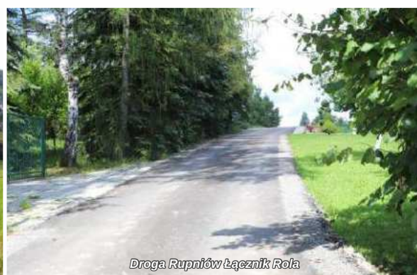
Droga Rupniów Łącznik Rola