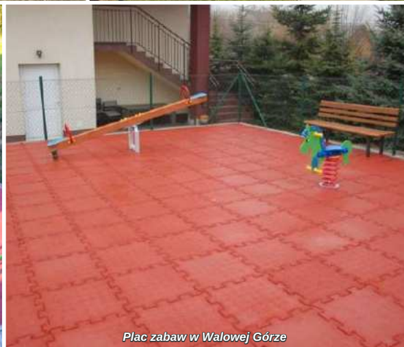
Plac zabaw w Wałowej Górze