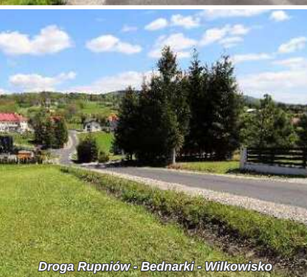
Droga Rupniów - Bednarki - Wilkowisko