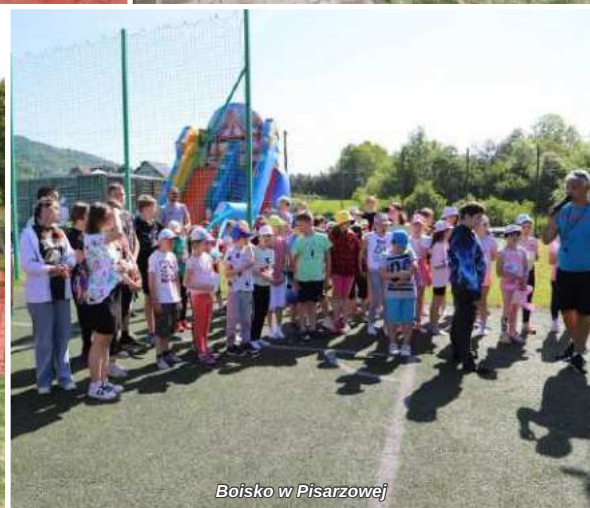
Boisko w Pisarzowej