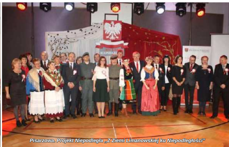
Pisarzowa. Projekt Niepodległa „Z Ziemi Limanowskiej ku Niepodległości”

W środowisku wiejskim biblioteka odgrywa niezwykle istotną rolę jako centrum kultury i edukacji. To nie tylko instytucja, gdzie można wypożyczyć książki czy korzystać z Internetu, ale to także serce społeczności, której księgarnia dostarcza wiedzy, inspiracji i tworzy wspólnotę.