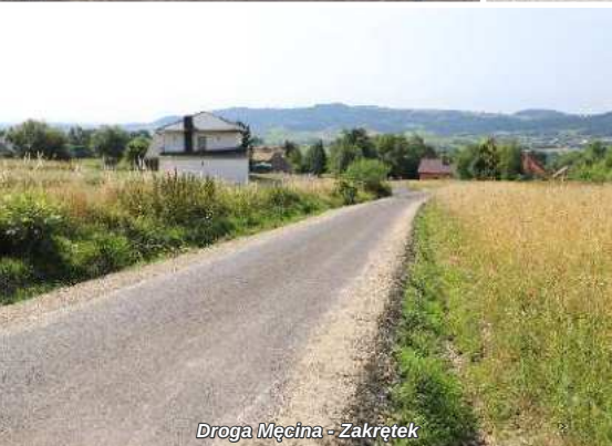
Droga Męcina - Zakrętek