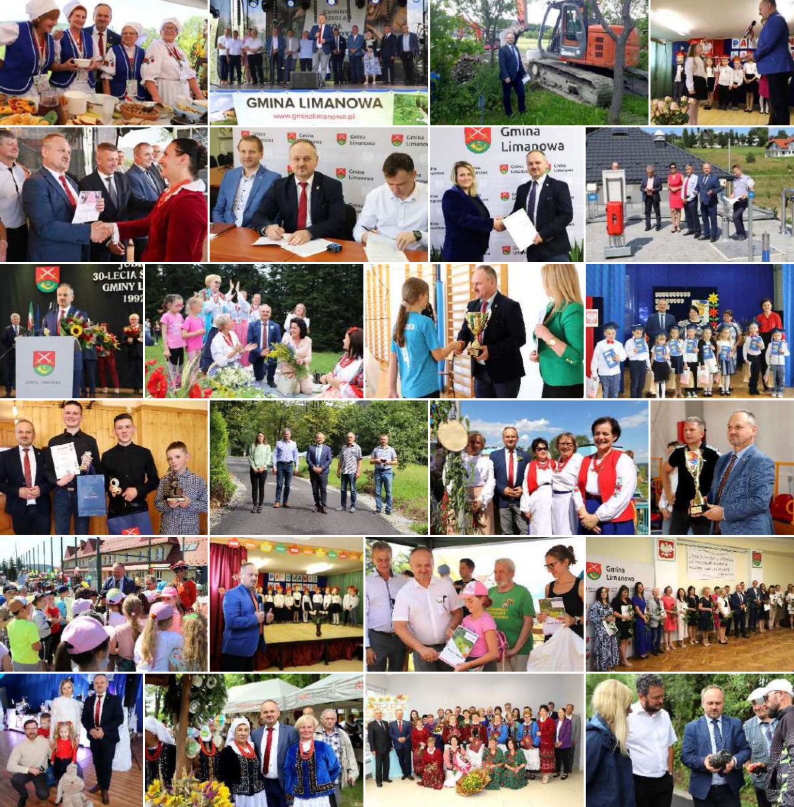
- 5 lat z Mieszkańcami i dla Mieszkańców Gminy Limanowa -