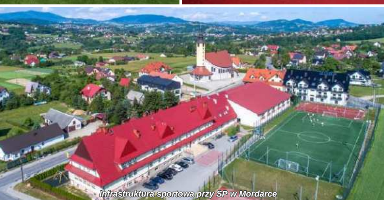
Infrastruktura sportowa przy SP w Mordarce