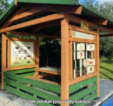
Szlak edukacyjny w Wysokiem