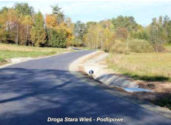
Droga Stara Wieś - Podlipowe