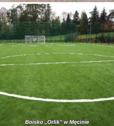
Boisko „Orlik” w Męcinie