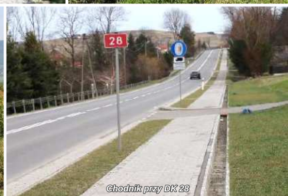
Chodnik przy DK 28