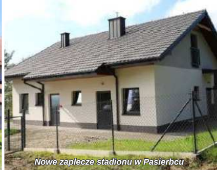
Nowe zaplecze stadionu w Pasierbcu

Do bardzo ważnych inwestycji sportowych z pewnością zaliczyć należy również wybudowane zaplecze sportowe w Pasierbcu, gdzie powstał budynek zaplecza socjalnego wraz z instalacją elektryczną, wodno-kanalizacyjną, c.o., gazową oraz infrastrukturą techniczną. Rozbudowywane jest aktualnie również zaplecze sportowe w Mordarce, a lada chwila ma ruszyć wyczekiwana budowa zaplecza sportowego w Starej Wsi. W Starej Wsi-Woli powstał również nowy kompleks boiska i kortu do tenisa, który pozwala młodzieży komfortowo i z dala od przydrożnego zgiełku uprawiać sport na świeżym powietrzu.