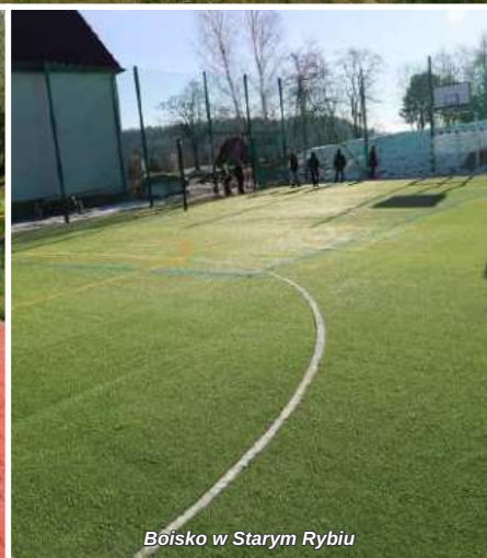
Boisko w Starym Rybiu