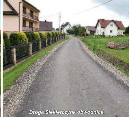
Droga Siekierzyna obwodnica