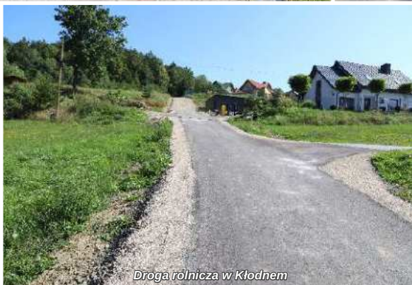
Droga rolnicza w Kłodnem