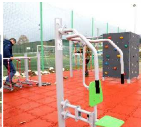
Plac zabaw i siłownia zewnętrzna przy Szkole Podstawowej w Pisarzowej