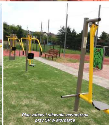
Plac zabaw i siłownia zewnętrzna przy SP w Mordarce