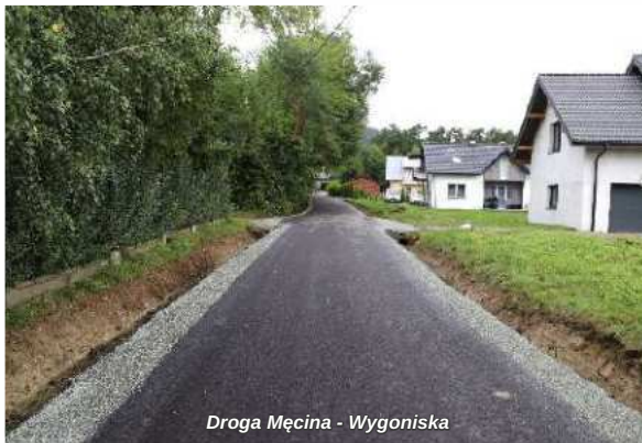
Droga Męcina - Wygoniska