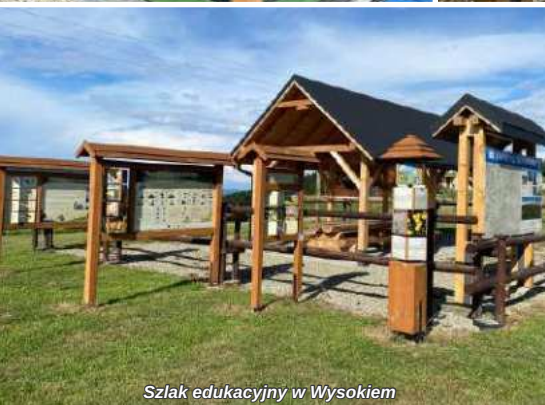
Szlak edukacyjny w Wysokiem