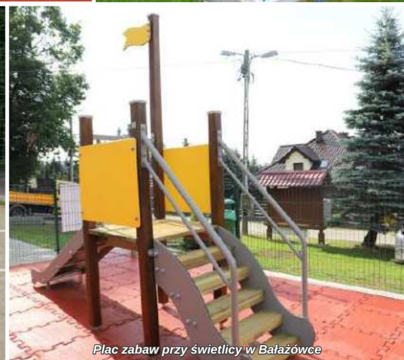
Plac zabaw przy świetlicy w Bałazówce