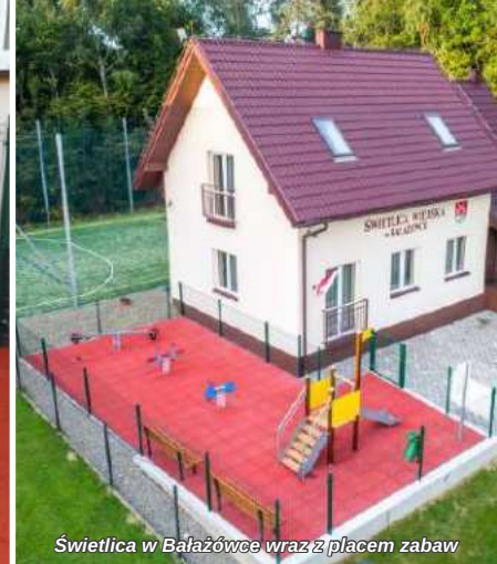
Świetlica w Bałazówce wraz z placem zabaw