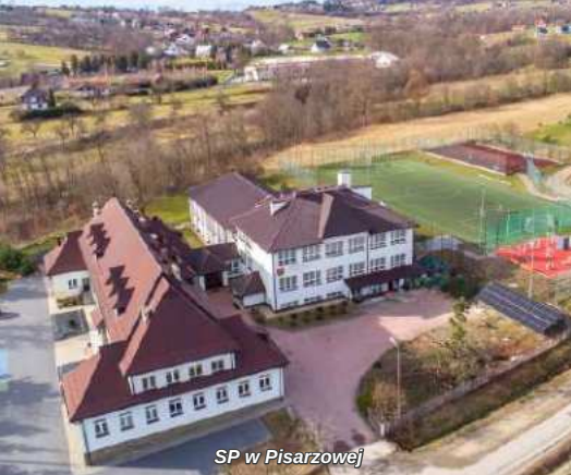
SP w Pisarzowej