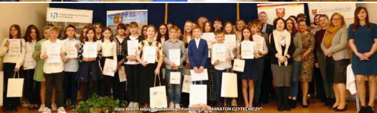
Stara Wieś. I edycja Powiatowego Konkursu pt. „MARATON CZYTELNICZY”