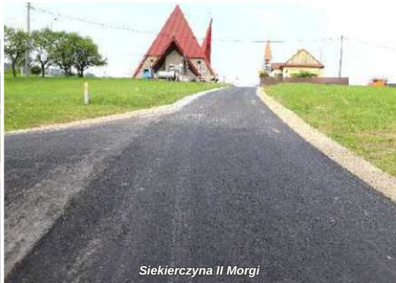
Siekierzyna II Morgi