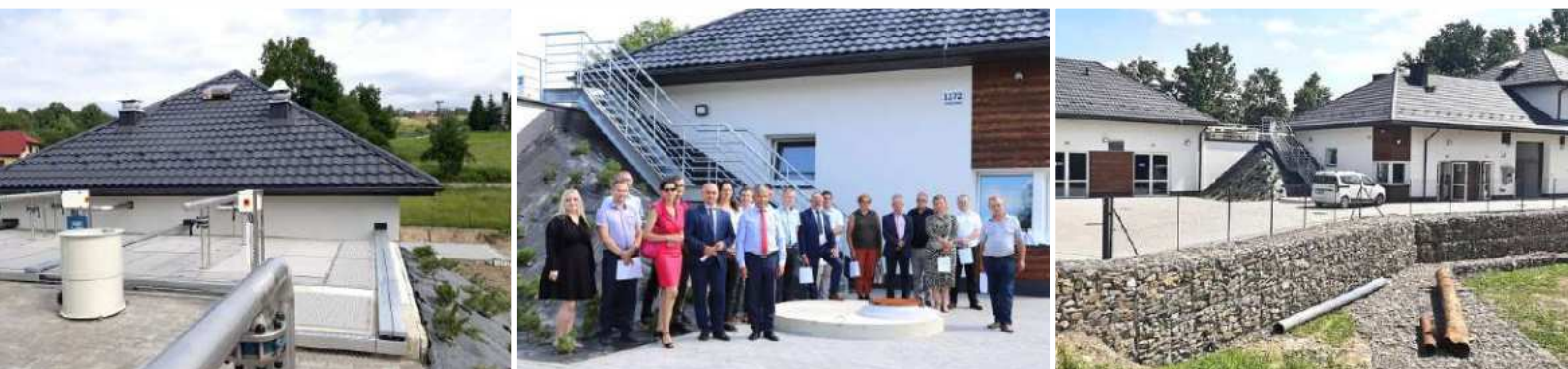
Oczyszczalnia ścieków w Starej Wsi

Wszystkie te działania sprawiają, że w kwestii kanalizowania terenu zaczynamy odrabiać zaległości i próbujemy dotrzymać kroku w ramach posiadanych możliwości, wymaganiom, jakie stawia przed nami w tej materii rzeczywistość.