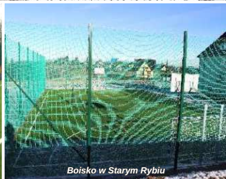
Boisko w Starym Rybiu