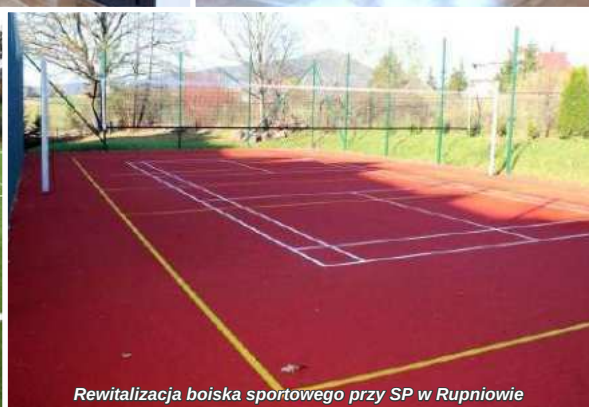
Rewitalizacja boiska sportowego przy SP w Rupniowie