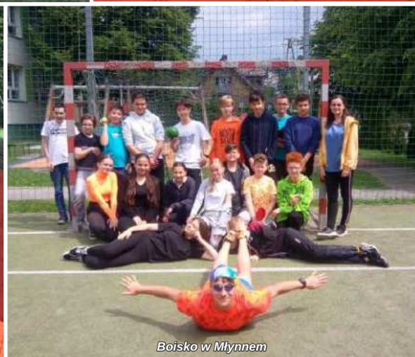
Boisko w Młynem