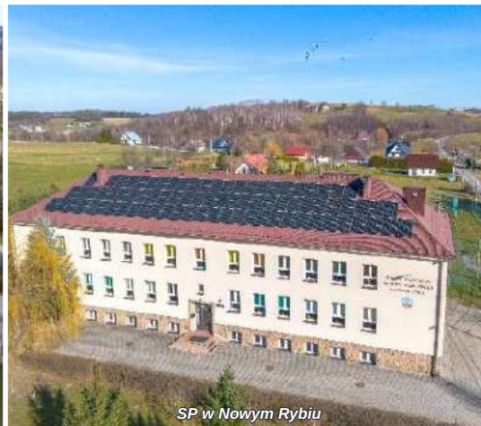
SP w Nowym Rybiu