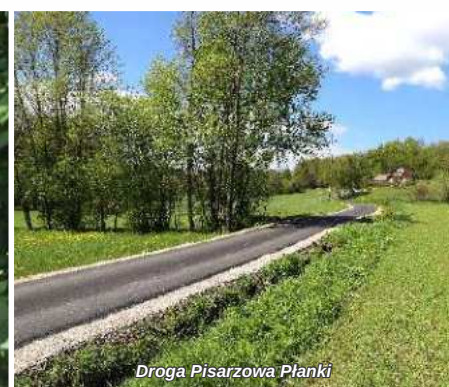
Droga Pisarzowa Planki