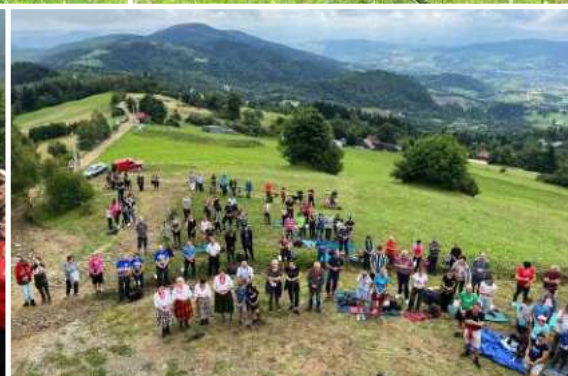
Spotkanie turystów na górze Jaworz w ramach akcji „Odkryj Beskid Wyspowy”