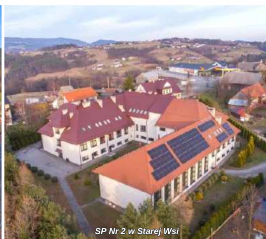
SP Nr 2 w Starej Wsi