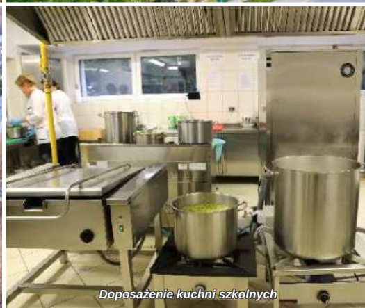
Doposażenie kuchni szkolnych