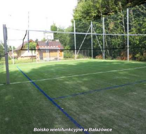
Boisko wielofunkcyjne w Bałazówce