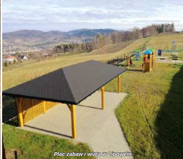
Plac zabaw i wiata w Lipowem