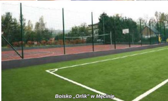
Boisko „Orlik” w Męcinie