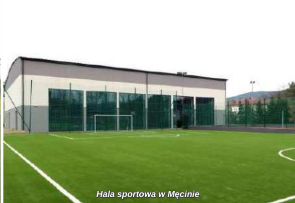
Hala sportowa w Męcinie