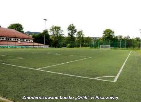
Zmodernizowane boisko „Orlik” w Piszczowicach