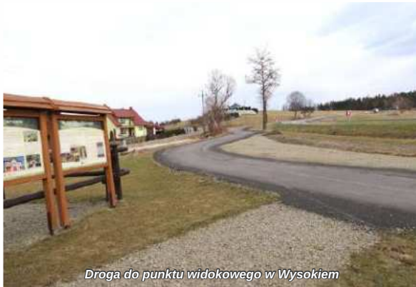
Droga do punktu widokowego w Wysokiem