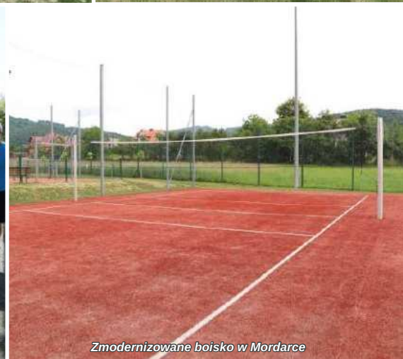
Zmodernizowane boisko w Mordarce