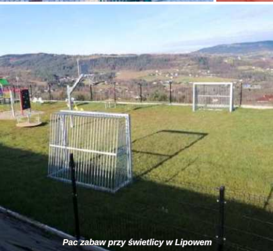
Plac zabaw przy świetlicy w Lipowem