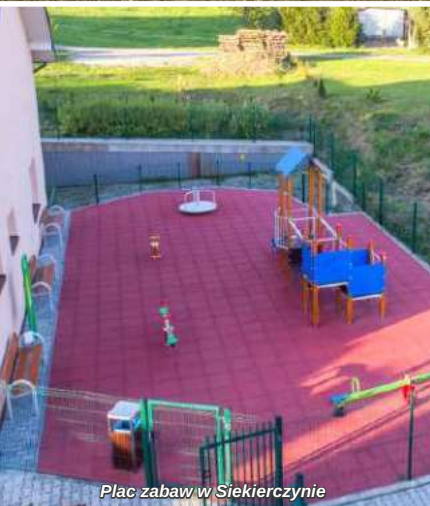
Plac zabaw w Siekierczynie