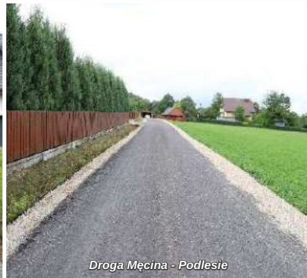
Droga Męcina - Podlesie