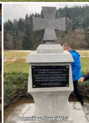
Pomnik w Starej Wsi