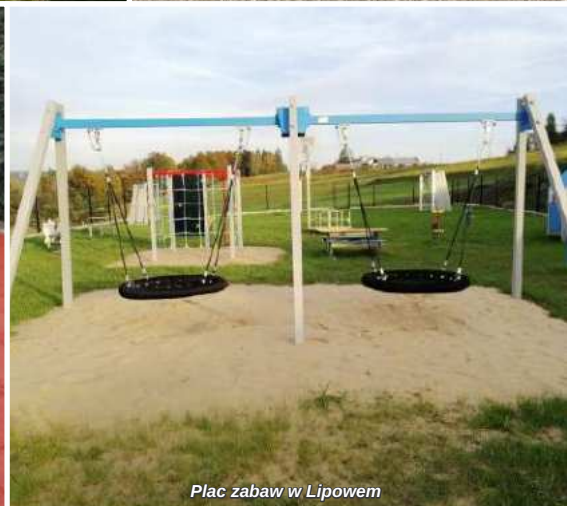
Plac zabaw w Lipowem