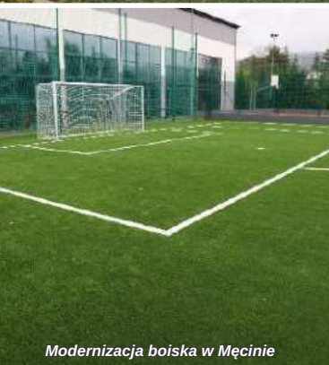
Modernizacja boiska w Męcinie