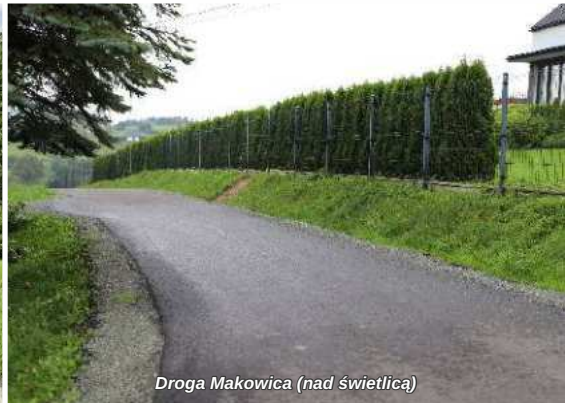
Droga Makowica (nad świetlicą)