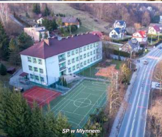
SP w Młynnem