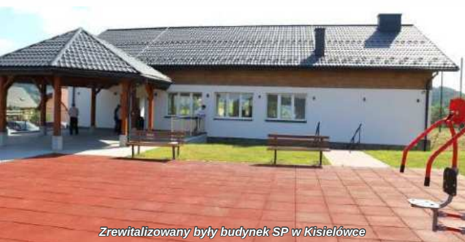
Zrewitalizowany budynek SP w Kisielówce

Rozwój bazy sportowej to nic innego, jak tworzenie przestrzeni dla rozwoju talentów sportowych. To często nigdzie indziej tylko właśnie tam, na przyszkolnych czy sołeckich obiektach, rodzą się i kielkują (następnie napawając nas wszystkich dumą swoimi osiągnięciami) autentyczne talenty.