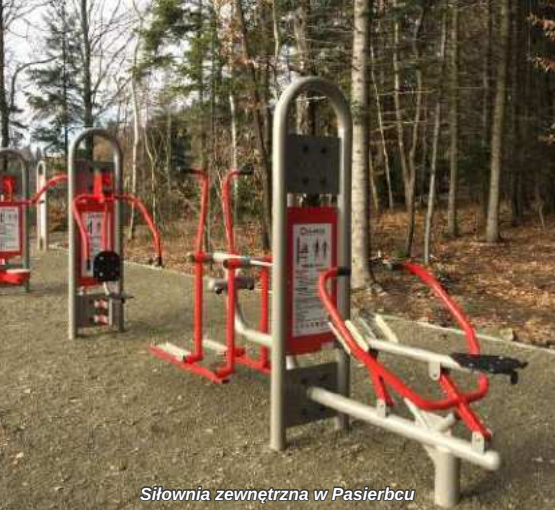
Siłownia zewnętrzna w Pasierbcu