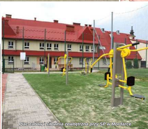
Plac zabaw i siłownia zewnętrzna przy SP w Mordarce