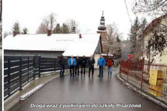
Droga wraz z parkingiem do szkoły Pisarzowa

Spośród zrealizowanych w ostatnich pięciu latach około 160 odcinków dróg przedstawiamy Państwu tylko niektóre, bo skala przedsięwzięć drogowych zrealizowanych przez Gminę Limanowa jest olbrzymia. Na uwagę zasługują też przedsięwzięcia inwestycyjne realizowane wspólnie z Generalną Dyрекcją Dróg i Autostrad, Województwem Małopolskim i Powiatem Limanowskim. W szczególności wymienić należy tutaj chodniki wraz z zatokami przystankowymi w Mordarce i Wysokiem przy drodze krajowej nr 28 oraz odnowienie „starodroży” w Wysokiem, chodniki z przejściami dla pieszych i zatokami przystankowymi w Męcinie, Rupniowie i Mordarce przy drogach powiatowych, przejścia dla pieszych w Młynem przy drodze wojewódzkiej.