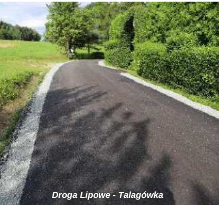
Droga Lipowe - Talagówka