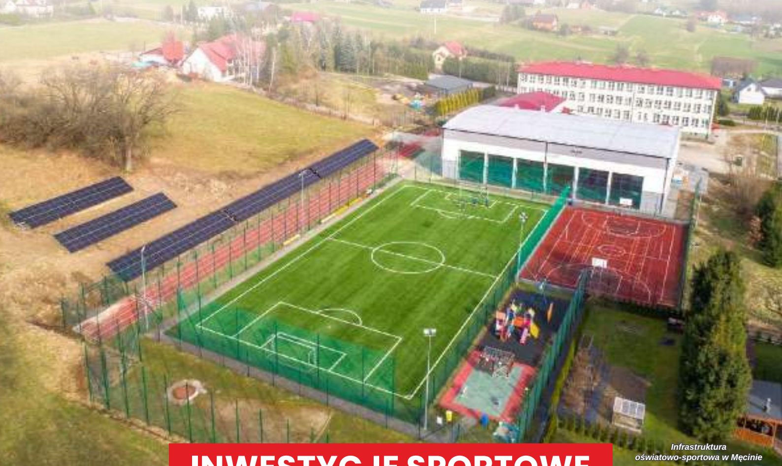
Infrastruktura oświatowo-sportowa w Męcinie

PODSUMOWANIE SKUTECZNEGO ROZWOJU GMINY LIMANOWA