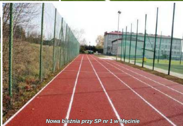
Nowa bieżnia przy SP nr 1 w Męcinie