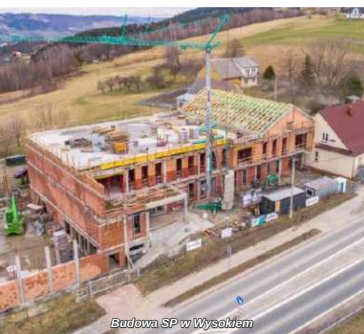
Budowa SP w Wysokiem