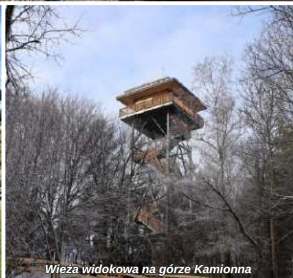
Wieża widokowa na górze Kamionna