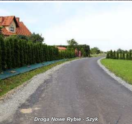
Droga Nowe Rybie - Szyk