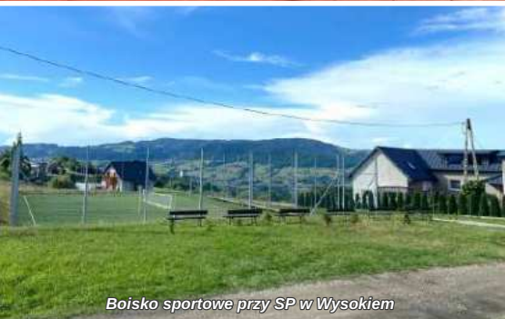
Boisko sportowe przy SP w Wysokiem