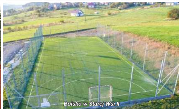
Boisko w Starej Wsi II