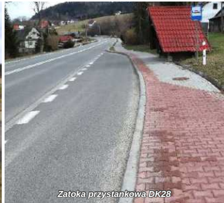
Zatoka przystankowa DK28