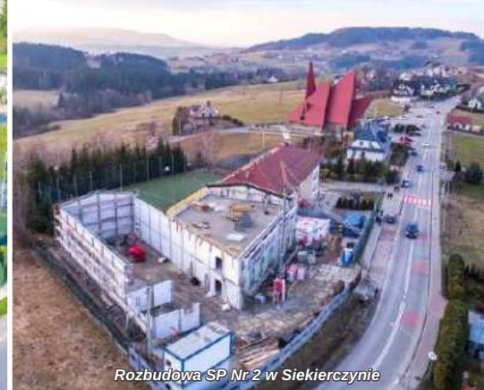
Rozbudowa SP Nr 2 w Siekierzynie