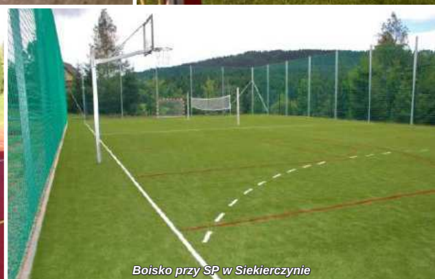
Boisko przy SP w Siekierczynie