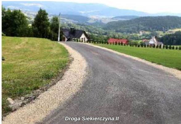
Droga Siekierzyna II