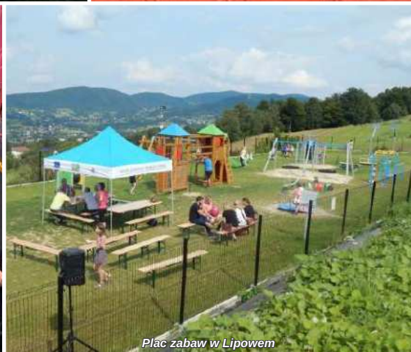
Plac zabaw w Lipowem