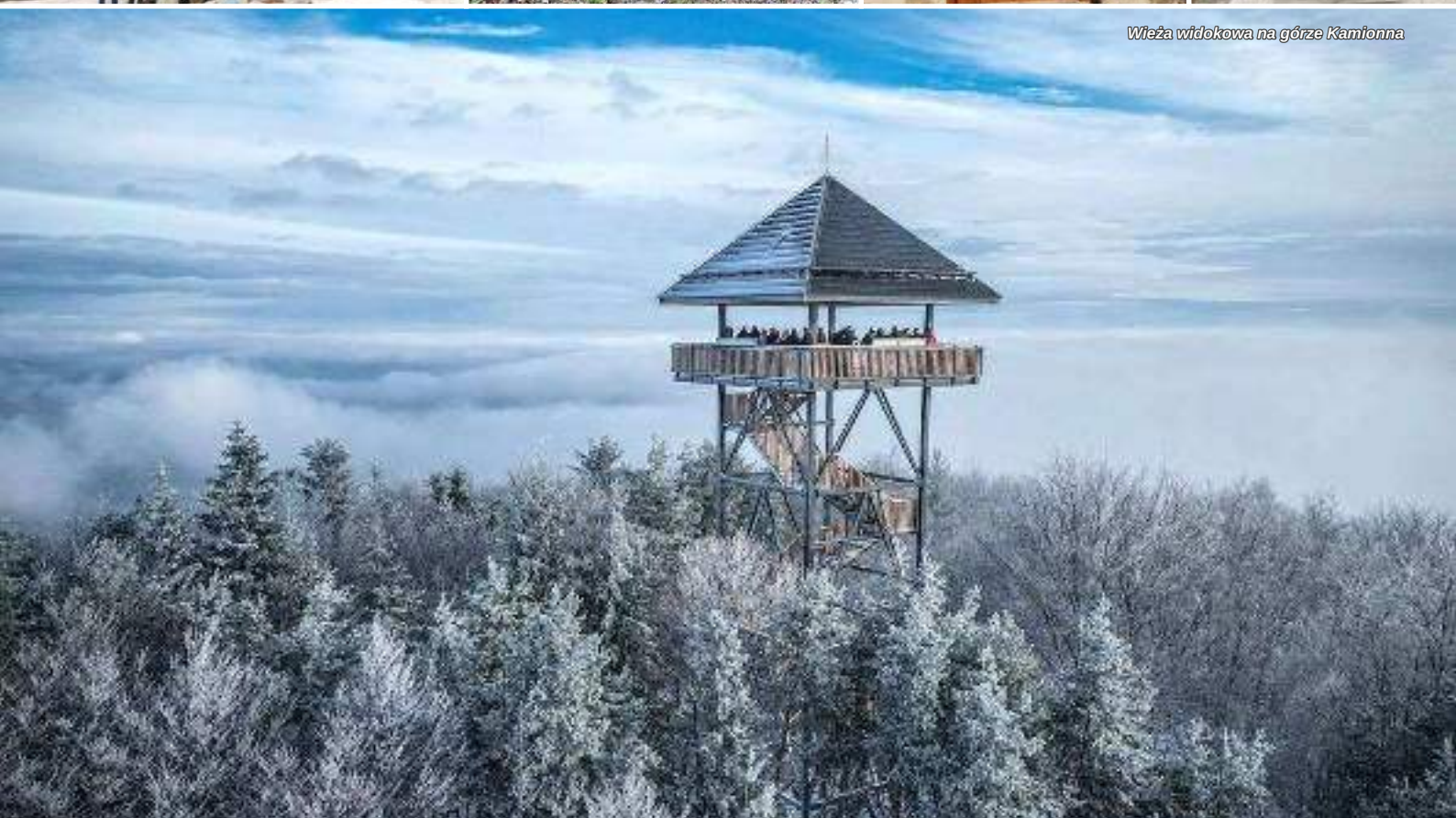
Wieża widokowa na górze Kamionna