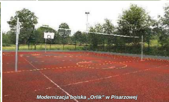
Modernizacja boiska „Orlik” w Pisarzowej