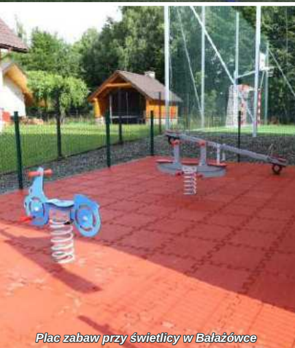
Plac zabaw przy świetlicy w Bałazówce