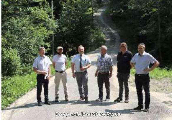
Droga rolnicza Stare Rybie