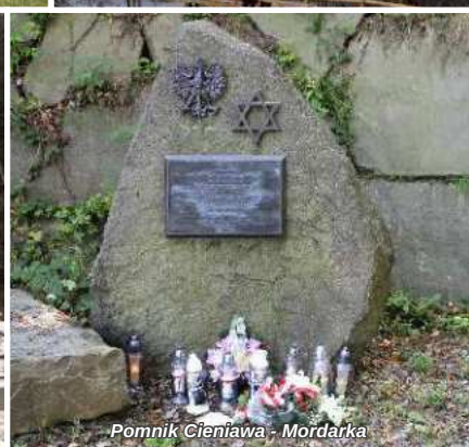
Pomnik Cieniawa - Mordarka