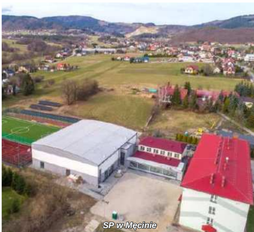
SP w Męcinie