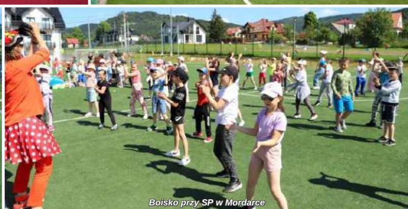
Boisko przy SP w Mordarce