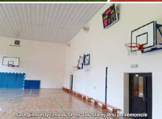
Sala gimnastyczna w SP nr 1 w Starej Wsi po remoncie