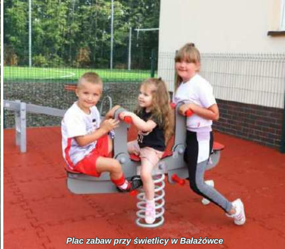
Plac zabaw przy świetlicy w Bałazówce