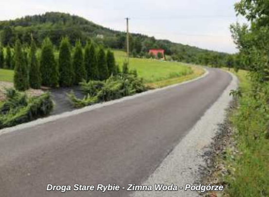
Droga Stare Rybie - Zimna Woda - Podgórze