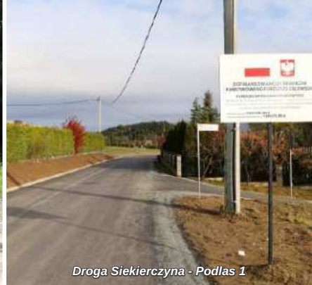
Droga Siekierzyna - Podlas 1