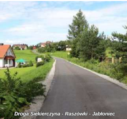
Droga Siekierzyna - Raszków - Jablonec