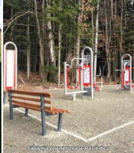
Siłownia zewnętrzna w Pasierbcu