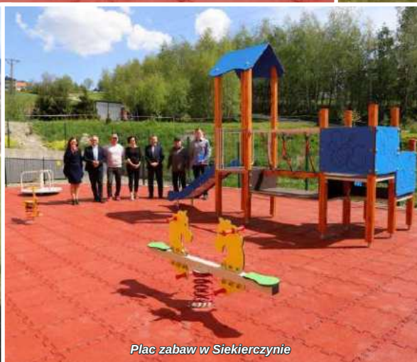
Plac zabaw w Siekierczynie