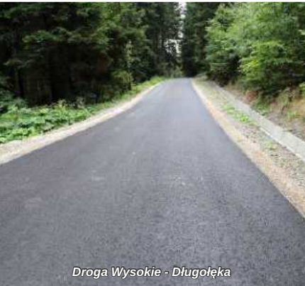
Droga Wysokie - Długoleka