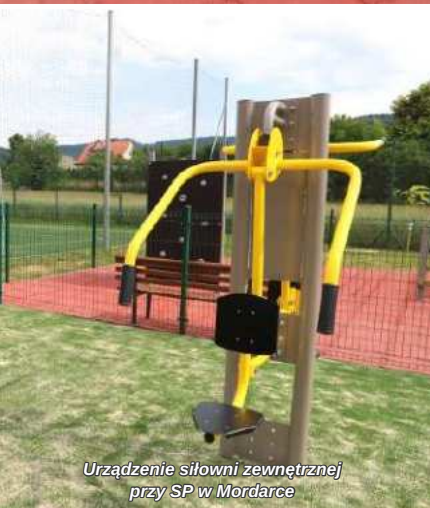
Urządzenie siłowni zewnętrznej przy SP w Mordarce