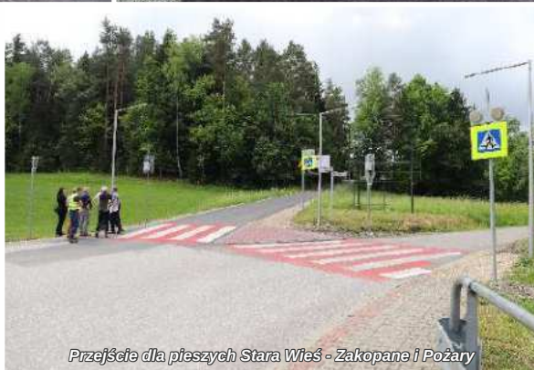
Przejście dla pieszych Stara Wieś - Zakopane i Pożary