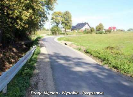
Droga Męcina - Wysokie - Przyszowa