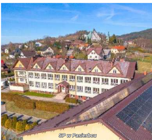
SP w Pasterbeu