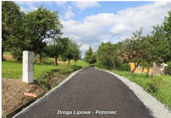
Droga Lipowe - Potoniec