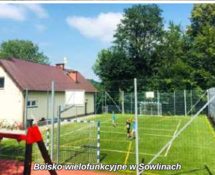
Boisko wielofunkcyjne w Sowlinach