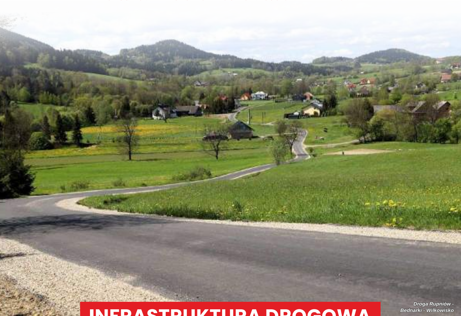
Droga Rupniów - Bednarki - Wilkowisko

PODSUMOWANIE SKUTECZNEGO ROZWOJU GMINY LIMANOWA