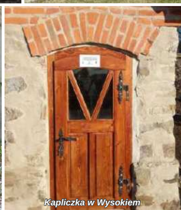
Kapliczka w Wysokiem