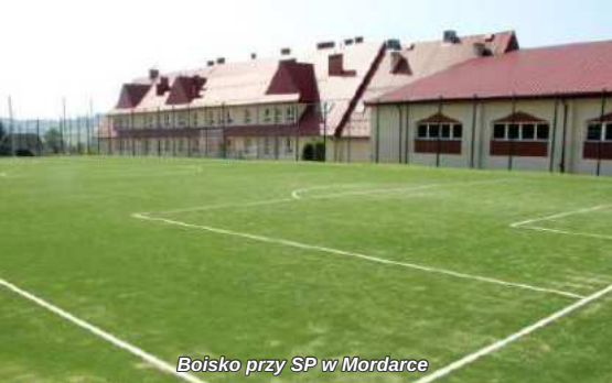
Boisko przy SP w Mordarce