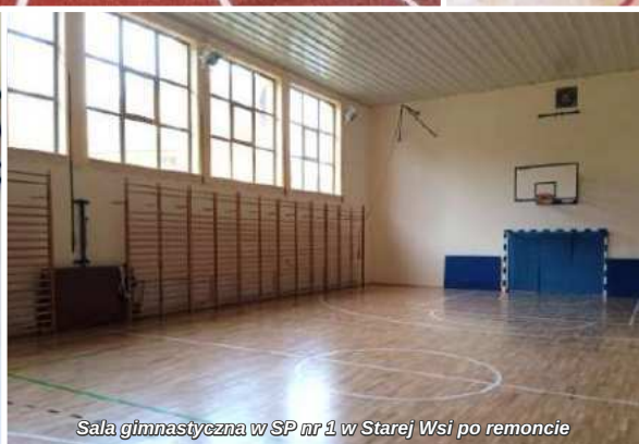
Sala gimnastyczna w SP nr 1 w Starej Wsi po remoncie