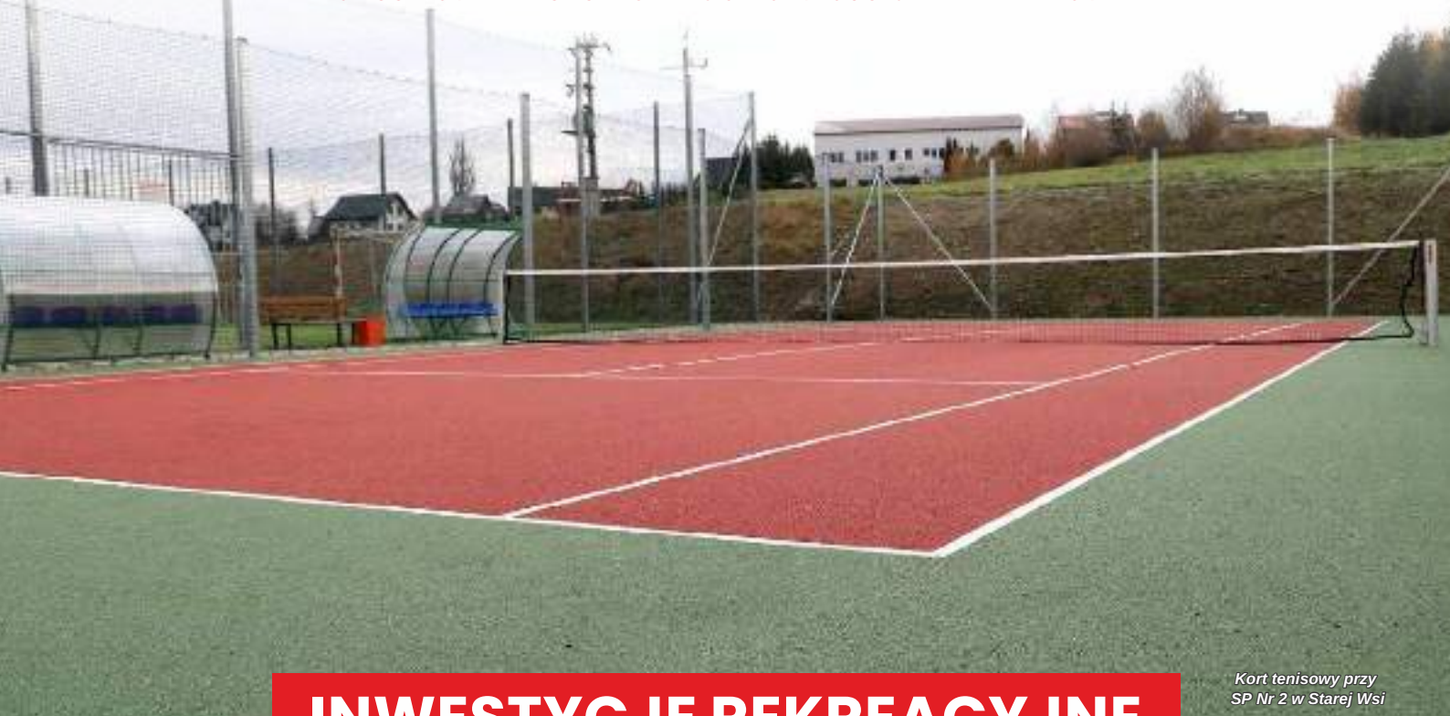
Kort tenisowy przy SP Nr 2 w Starej Wsi

PODSUMOWANIE SKUTECZNEGO ROZWOJU GMINY LIMANOWA