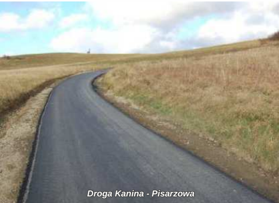
Droga Kanina - Piszczowa