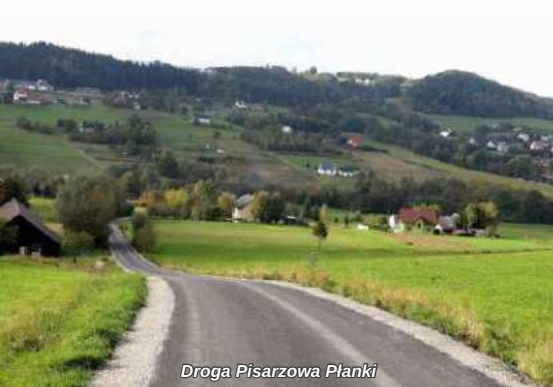
Droga Pisarzowa Planki

Dbamy o dobrą komunikację na terenie naszej Gminy. Poniżej prezentujemy kadry ważniejszych zadań drogowych realizowanych w obecnej kadencji.