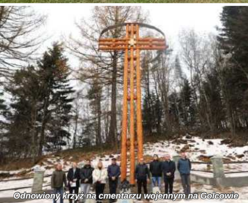
Odnowiony krzyż na cmentarzu wojennym na Golcowie