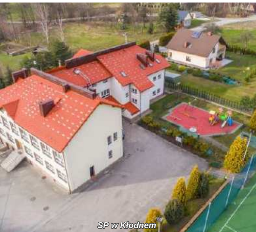
SP w Kłodnem