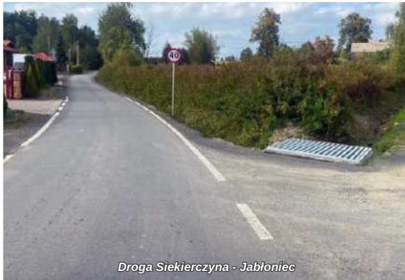
Droga Siekierzyna - Jablonec