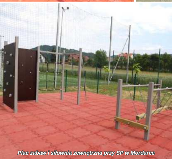
Plac zabaw i siłownia zewnętrzna przy SP w Mordarce