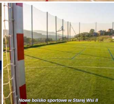
Nowe boisko sportowe w Starej Wsi II