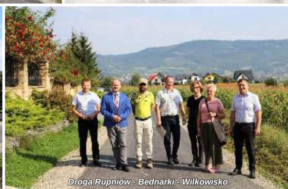
Droga Rupniów - Bednarki - Wilkowisko