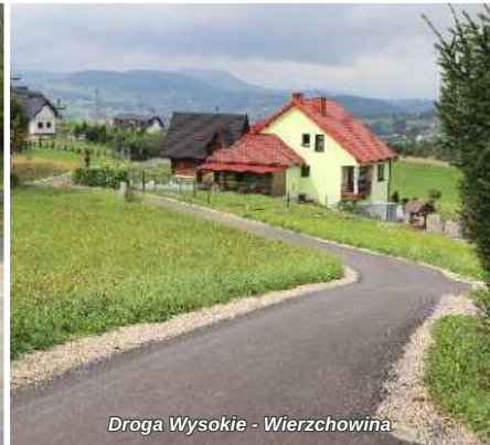
Droga Wysokie - Wierchowina