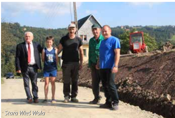
Stara Wieś Wola

Dobiegła końca inwestycja związana z przebudową drogi powiatowej w miejscowościach Koszary i Rupniów. Było to zadanie wykonywane przez powiat limanowski wspólnie z gminą Limanowa i gminą Jodłownik. Na wykonanie prac gmina Limanowa z własnego budżetu przekazała 1 mln 241 tys. zł. Roboty drogowe w miejscowościach Koszary i Rupniów dotyczyły budowy chodnika wraz z kanalizacją deszczową. Na długości nowopowstałych chodników wykonano także poszerzenie jezdni do szerokości co najmniej 6 metrów, utwardzono także istniejące zatoki i perony. Wykonawcą robót była firma LIMDROG.