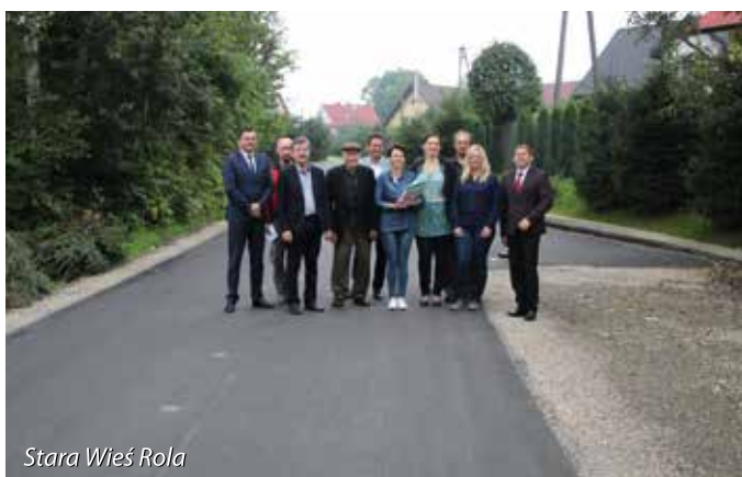
Stara Wieś Rola