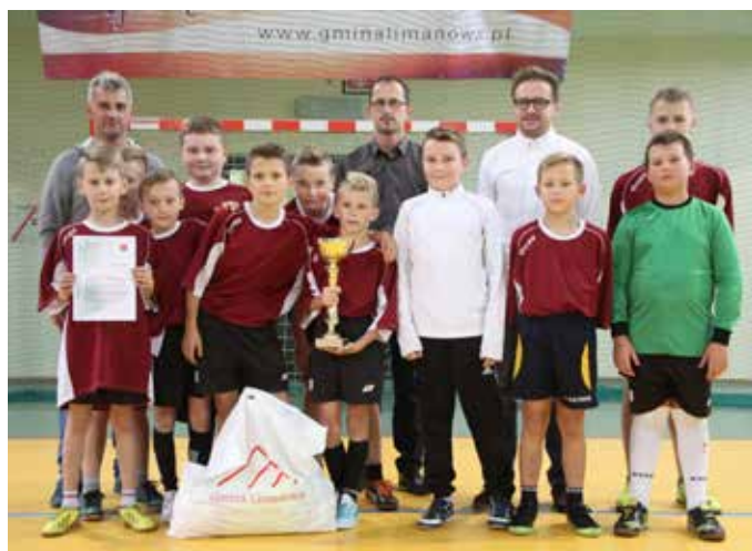
Piszczowa - halowa piłka nożna chłopców