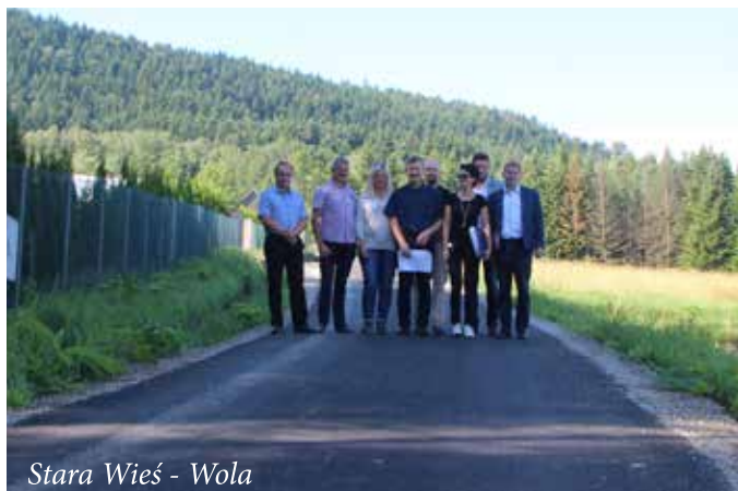
Stara Wieś - Wola