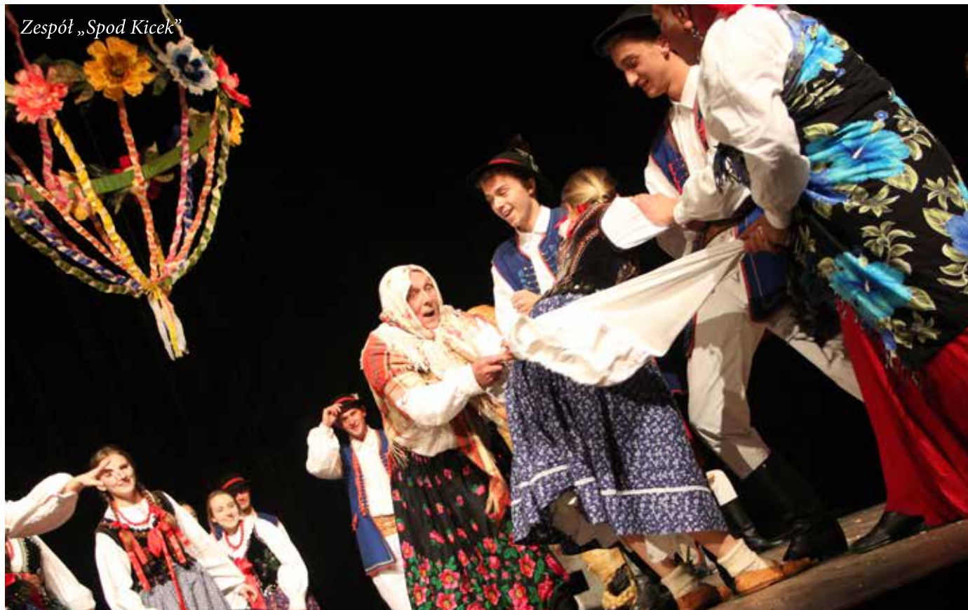
Zespół „Spod Kicek”

Czołowe miejsca nasi gminni artyści zdobyli za występy podczas 43. Festiwalu „Limanowska Słaza”, który w dniach 21-24 września odbywał się w Limanowskim Domu Kultury. Święto folkloru jakim jest Festiwal „Limanowska Słaza” w tym roku zgromadził 796 wykonawców, którzy prezentowali podczas 99 punktów programowych.