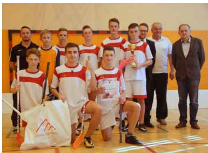
Męcina nr 1 - unihokej chłopców