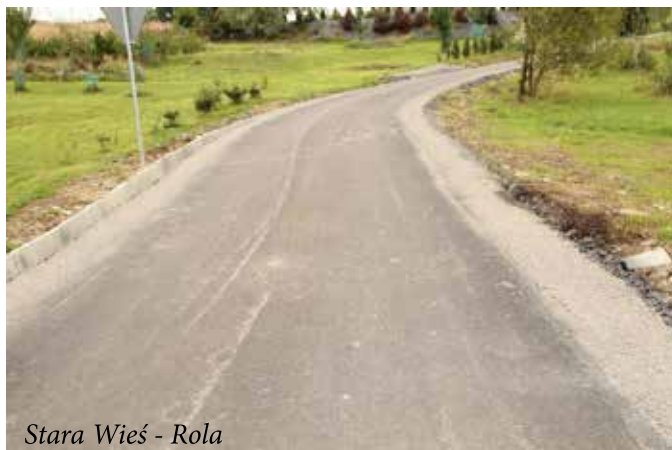
Stara Wieś - Rola