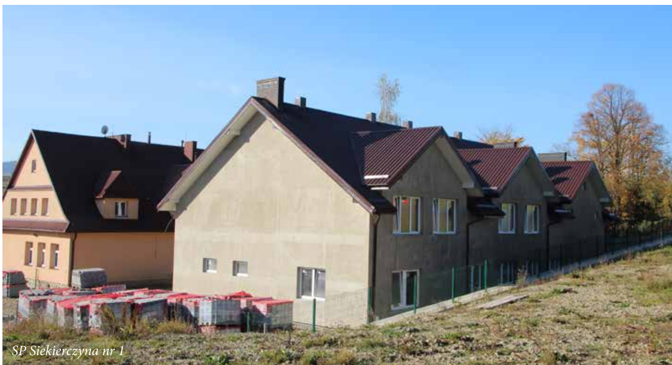
SP Siekierzyna nr 1

Ponad 250 tysięcy złotych z gminnego budżetu przeznaczono na inwestycje w budynkach oświatowych na terenie gminy Limanowa. W ostatnim okresie w szkołach wykonano niezbędne remonty, zrealizowano też nowe zadania inwestycyjne, które służyć mają podniesieniu standardu nauczania.