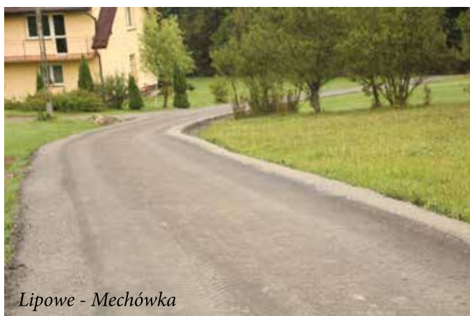
Lipowe - Mechówka