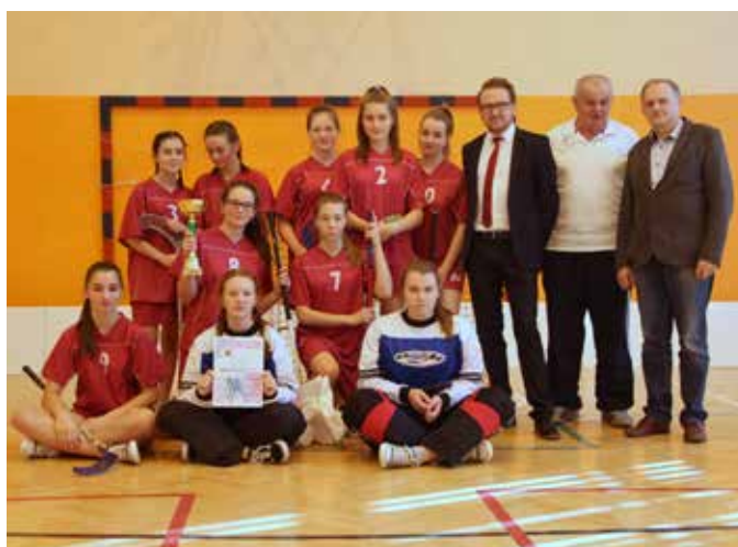
Stara Wieś 2 - unihokej dziewcząt