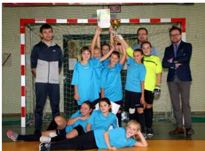
Mordarka - halowa piłka nożna dziewcząt