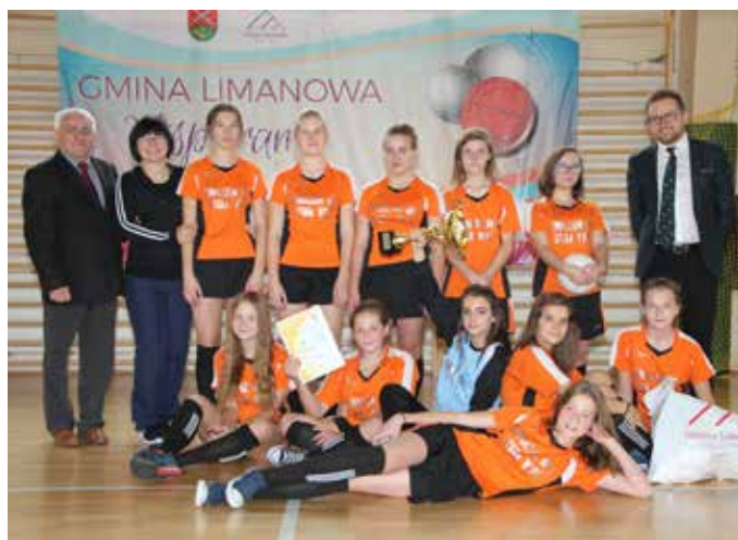
Stara Wieś nr 1 - halowa piłka nożna dziewcząt