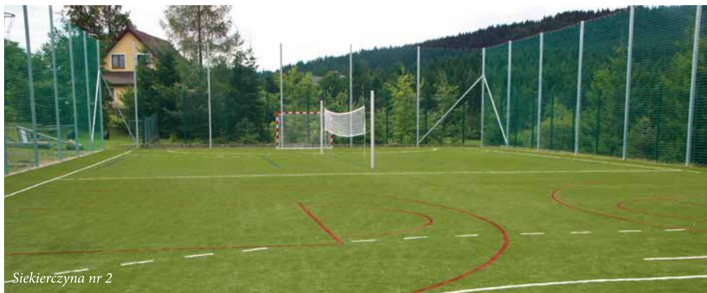
Siekierczyna nr 2