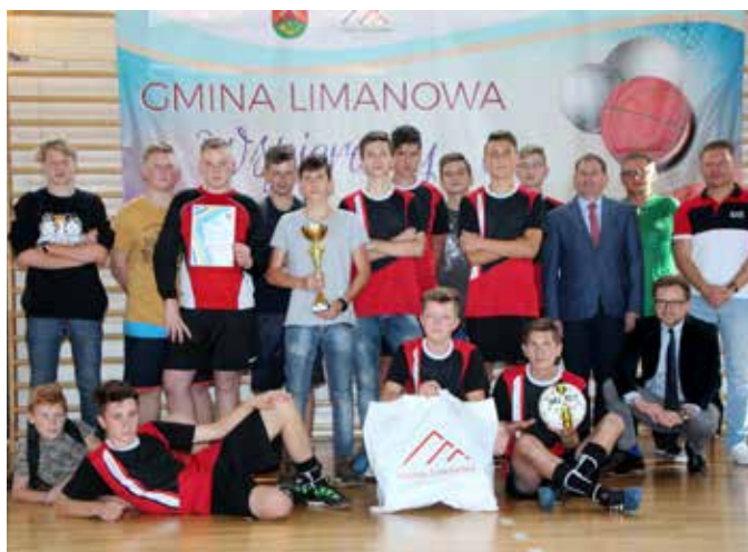
Rupniów - halowa piłka nożna chłopców