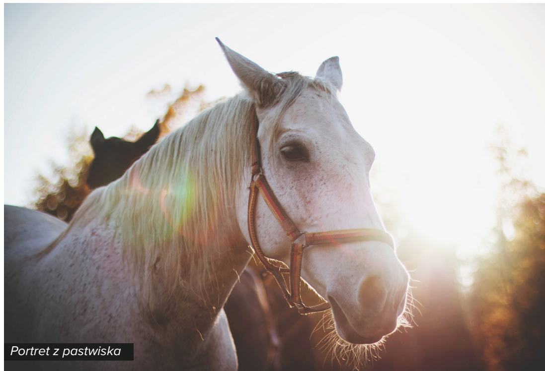
Portret z pastwiska