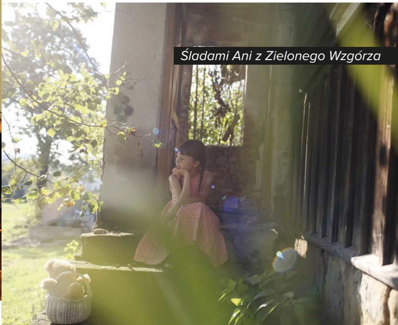
Śladami Ani z Zielonego Wzgórza