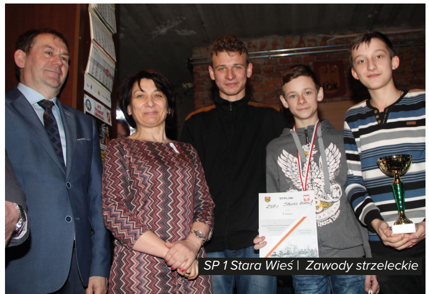
SP 1 Stara Wieś | Zawody strzeleckie