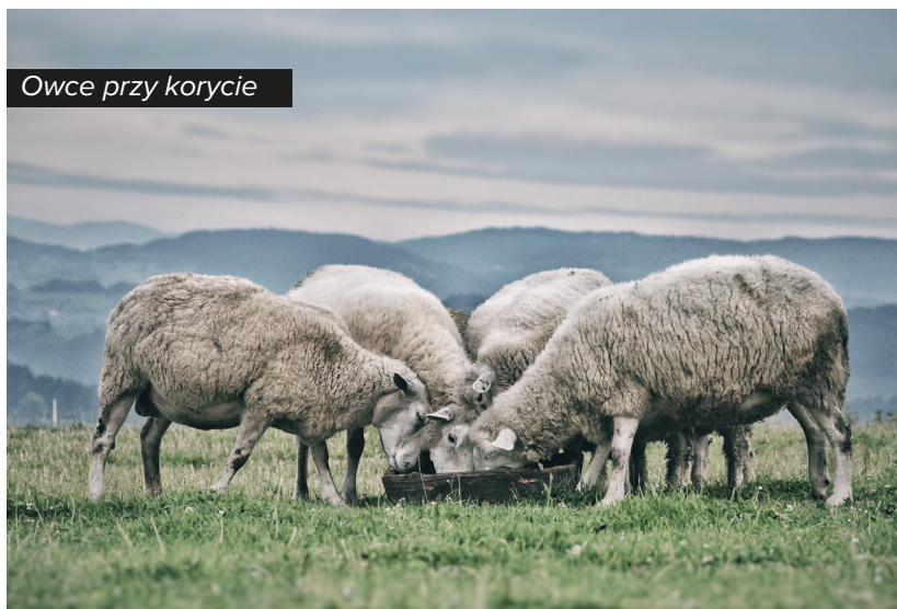
Owce przy korycie