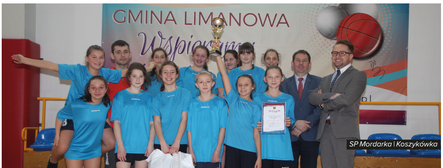
SP Mordarka | Koszykówka