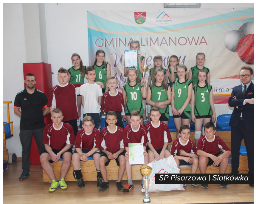
SP Pisarzowa | Siatkówka